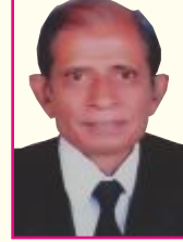
શ્રી ગીરીશચંદ્ર છેલશંકર અધ્યાક